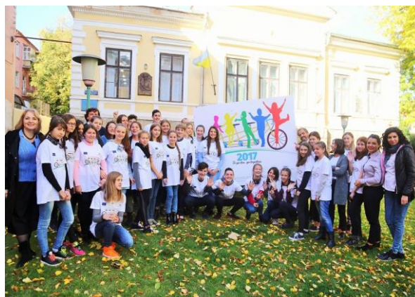
"Colour the border!", Suceava