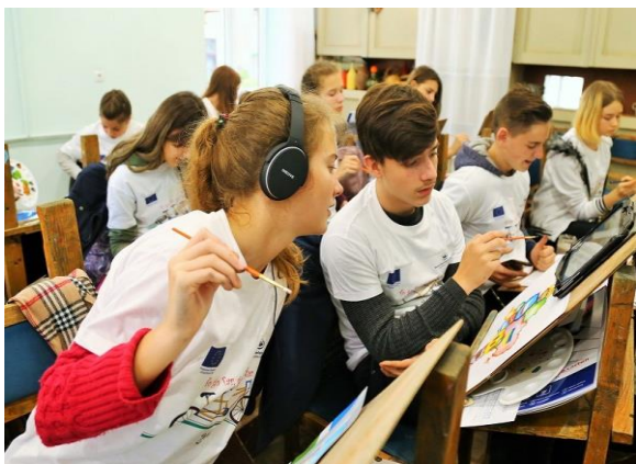
"Colour the border!", Cernăuți

Mai multe detalii și fotografii din campania ECDay, care au implicat 74 de orașe din Uniunea Europeană și din țările vecine, sunt disponibile pe site-ul oficial: https://www.ecday.eu/